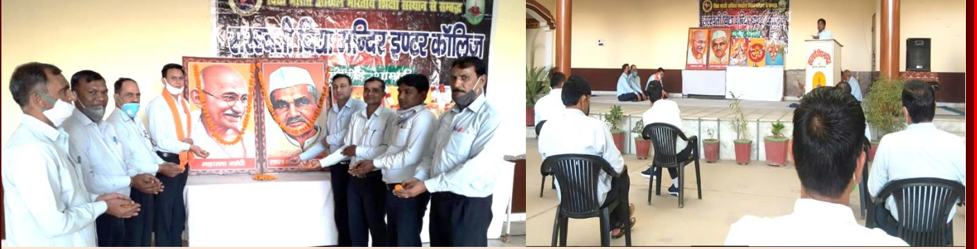
सरस्वती विद्या मन्दिर इण्टर कालिज, शामली