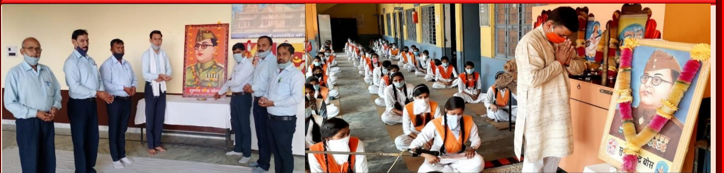
सरस्वती विद्या मन्दिर इण्टर कालिज, शामली