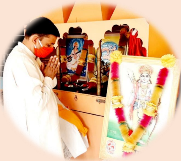
सरस्वती विद्या मन्दिर. सैद नंगली.अमरोहा