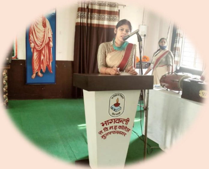
बालिका विद्या मन्दिर. मजफ्फरनगर