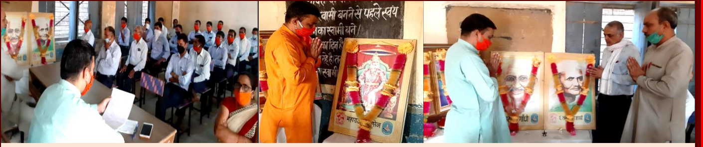
सरस्वती शिशु विद्या मंदिर इंटर कॉलेज सैद नगली अमरोहा