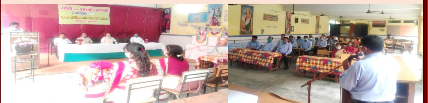
सरस्वती विद्या मन्दिर इण्टर कालिज, गुलाबवाड़ी, मुरादाबाद